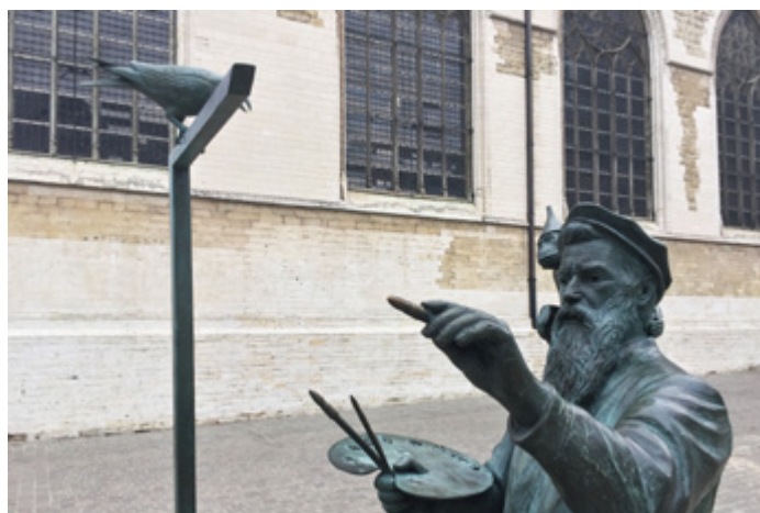
Brussel: pierewaaien met Bruegel

Zend je antwoord voor 20 oktober per mail of via brief naar info@linxplus.be of Linx+ Hoogstraat 42, 1000 Brussel. Vermeld ook je naam en adres zodat we het boek naar jou kunnen toezenden. De meest onschuldige Linx+ collega zal uit de inzendingen de winnaars loten.